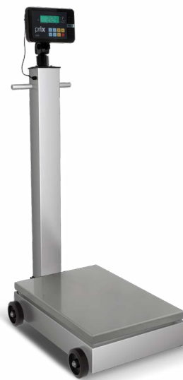
Versão coluna e rodas