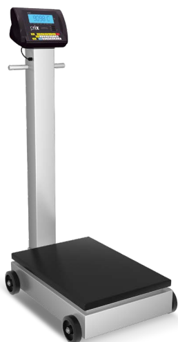
Versão coluna e rodas