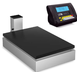
Versão indicação remota